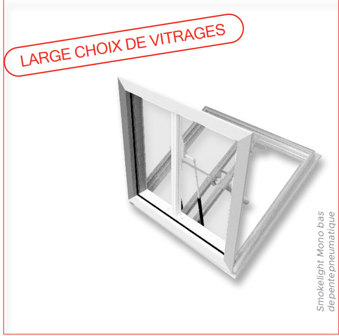
Smokelight Mono bas de pente pneumatique

VENTILIGHT est un DENFC (Dispositif d'Évacuation Naturelle de Fumées et de Chaleur) certifié CE - NF EN 12101-2 et bénéficiant du marquage NF - DENFC.