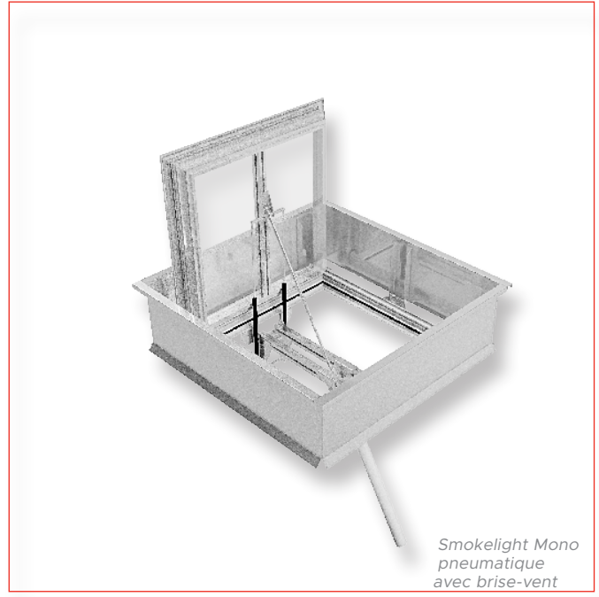
Smokelight Mono pneumatique avec brise-vent